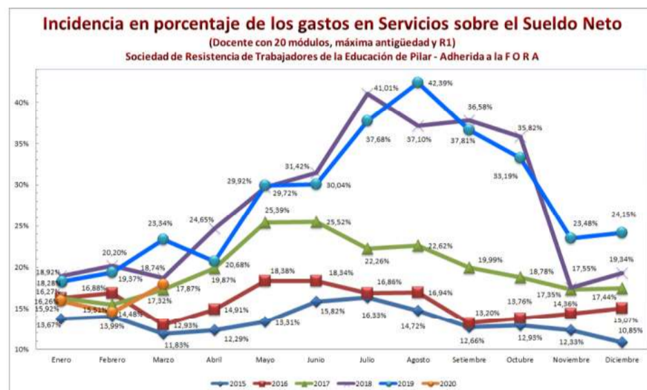
Cuadro 5: Estudio de la Variación Salarial Docente de la Pcia. de Buenos Aires (Con Arrastre de un año al otro)

Obsérvese que el 2020, a pesar de ser parcial, está por encima de los años 2015 y 2016; esto hace suponer que será mayor que estos años puesto que faltan considerar los meses en que los gastos en energías son más significativos (mayo a octubre) tal como puede apreciarse a continuación en el Cuadro 4.