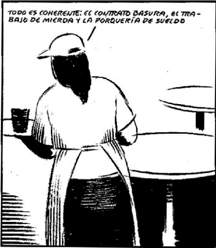
La negra Mangi

Más allá del resultado que se dio en las farsas electorales recientes, la situación de los y las trabajadoras de la Zona Norte del Gran Buenos Aires, viene en decadencia. Los empresarios están especulando y haciendo de la economía de la región lo que les da la gana, y esas decisiones solo nos traen más desocupación, la cual viene aumentando exponencialmente, de la mano de la precarización, y el trabajo informal.